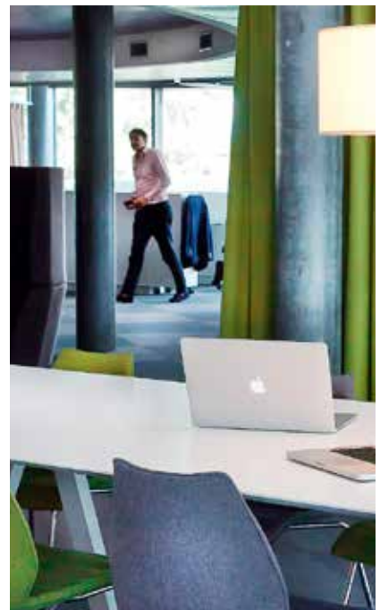
Nomadspace consacre 2650 m 2 au coworking et au télétravail, dans son centre de Vernier, à proximité de l'autoroute et de l'aéroport.